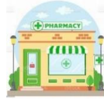
Double circuit de dispensation