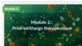
2. Prise en charge thérapeutique