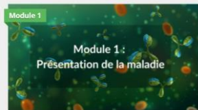
1. Présentation de la maladie